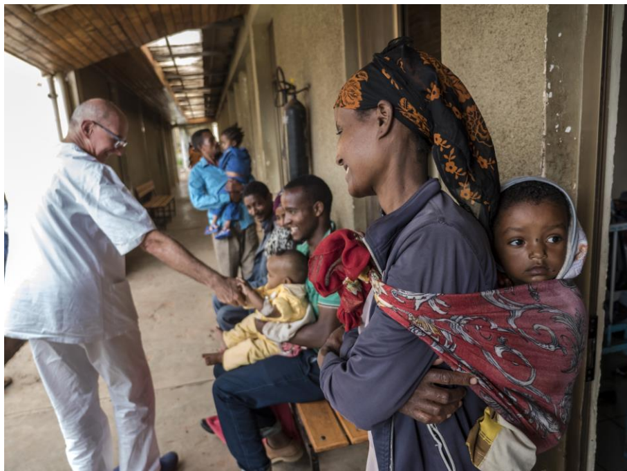
Il direttore sanitario dell'ospedale di Wolisso saluta i piccoli pazienti e i loro genitori