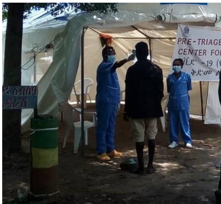
Gli operatori sanitari locali controllano la temperatura corporea all'ingresso del triage allestito all'esterno dell'ospedale