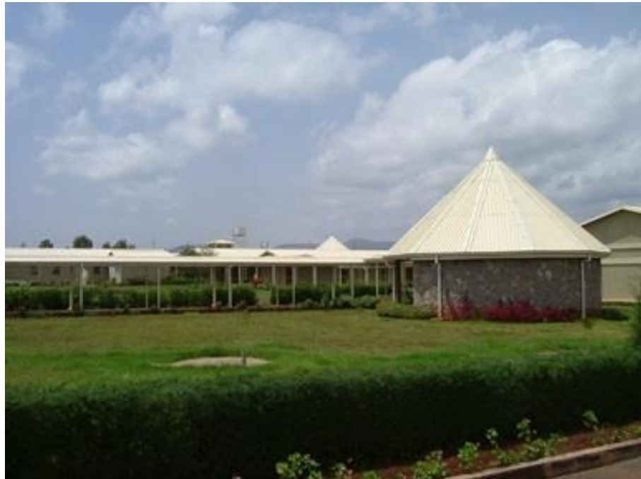
Esterno dell'ospedale St. Luke di Wolisso